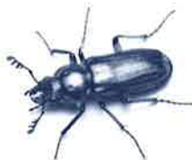
タカネルリクワガタ