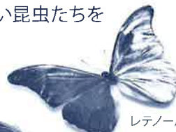
レテノール モルフォ