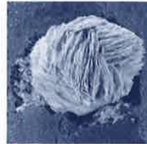
方解石の花弁状結晶